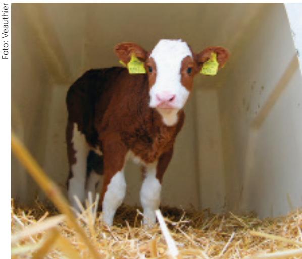
Bikarbonat-Pillen wirken in begrenztem Masse gegen Azidose bei Kälbern.